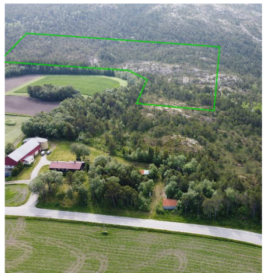
Figur 3. Dronebilde av dagens situasjon med foreløpig steinbruddavgrensning.

Det vil bli en sone rundt steinbruddet med LNFR innenfor det endelige planområdet. Det kan bli aktuelt med mindre og midlertidige bygg i forbindelse med driften. Dette er typisk brakkebebyggelse for lagring av utstyr samt opphold i pauser. Det er pr. nå usikkert om det