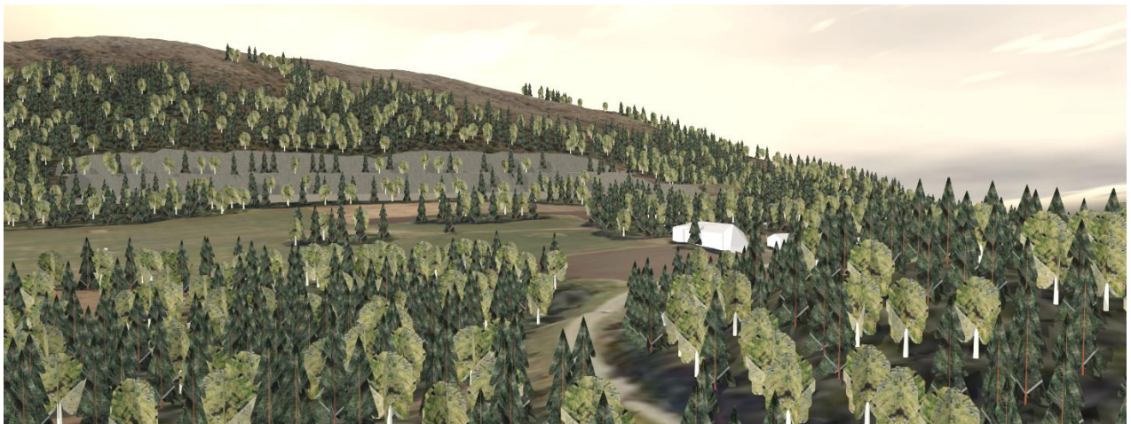
Figur 2. Illustrasjon av størrelsesomfang og hvordan bruddet kan se ut etter endt drift.

Med et terrenginngrep som et steinbrudd er, så vil det gjøres tilpasninger for å begrense synligheten. Dette kan være å beholde terreng på sidene, begrense høyde på bruddveggene og revegetere bruddveggene fortløpende (figur 2).